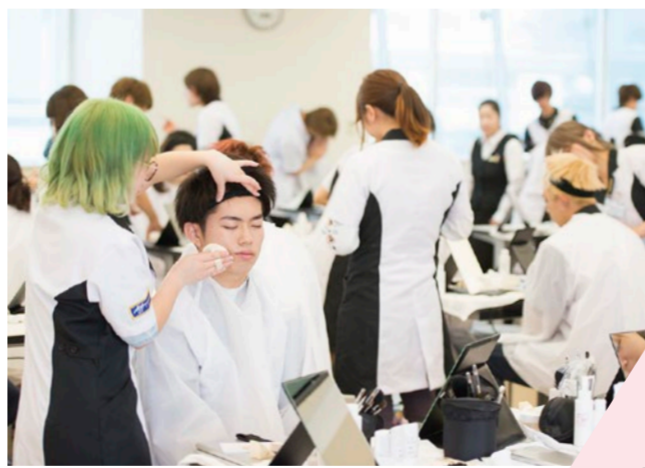
メイク、ヘアのほか着付けなどの授業を行う

理事長はさらに一言。 山野学苑は、変化を遂げる社会で必要とされる人材育成を発展・継続し、次の10年20年後も美容教育の最先端であり続ける。