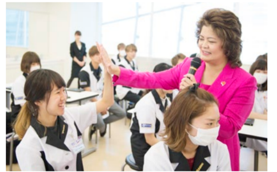
一人ひとりのコミュニケーションを大切にしている

学生達には、精神美の大切さ、社会人としての心構えについて、こんなふうに語りかけている。 「社会に出たとき、最低限の技術はもちろんです。それよりも礼儀や他者への心配り、困難を乗り越えられるタフさなど、心の美しさと強さが求められるのです」